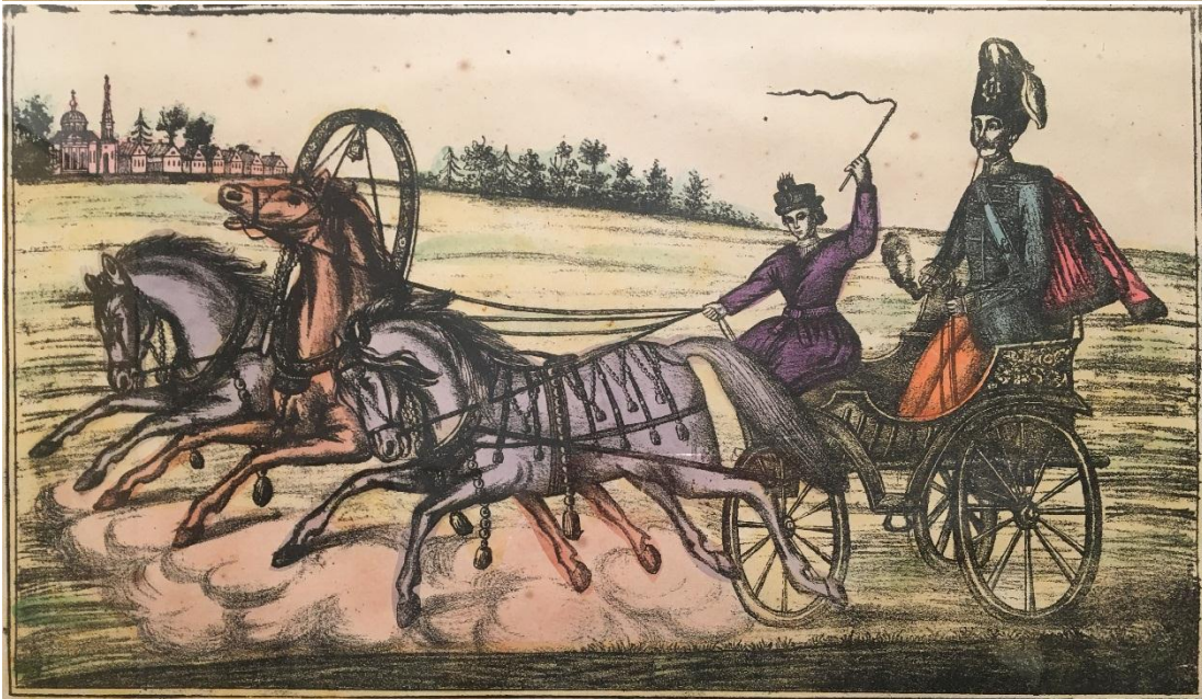
Двадцать Ценою 1 рубль Москва 26. Марта 1845 г.

Владимиръ Губ. Ездниковск. уезда. Церковь Богоявления, въ которой погребены Князь Ромодановскіе. Церк. Иоанна Милостиваго Церк. Единореческая. Река Мстера.